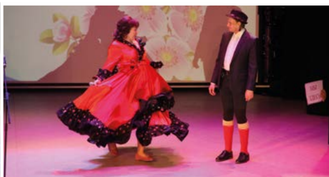
В 2018 году в «Гатчинской КМБ» прошла первая игра КВН на Кубок главного врача! А еще мы сдали нормы ГТО!